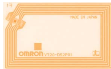
Figuur 1. Een RFID-tag. De stip linksboven is de chip, de koperen banen vormen de antenne.

Een RFID-radio-etiket (tag of transponder) is het onderdeel van een RFID-systeem dat wordt bevestigd op een object. Een tag bestaat uit een aantal onderdelen te weten: een chip, een antenne en een omhulsel.